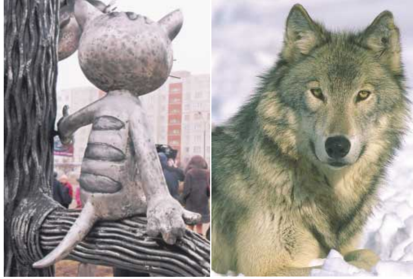
В отличие от воронежского котенка, увековеченного в бронзе, тамбовского волка можно встретить только в лесу