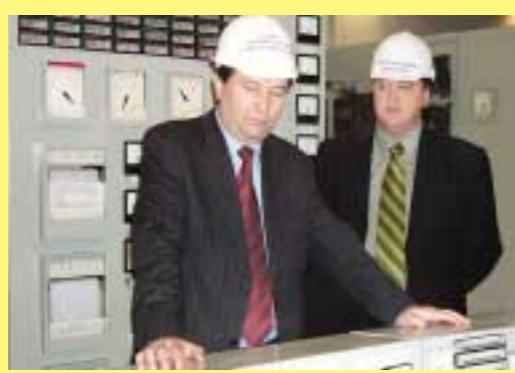
Слева направо: глава администрации Тамбовской области Олег Бетин и генеральный директор ОАО «Тамбовэнерго» Александр Крапивин на щите управления Тамбовской ТЭЦ во время прохождения осенне-зимнего максимума нагрузки

Точкой отсчета нового этапа стало учреждение открытого акционерного общества энергетики и электрификации «Тамбовэнерго» на базе районного энергетического управления в 1992 году.