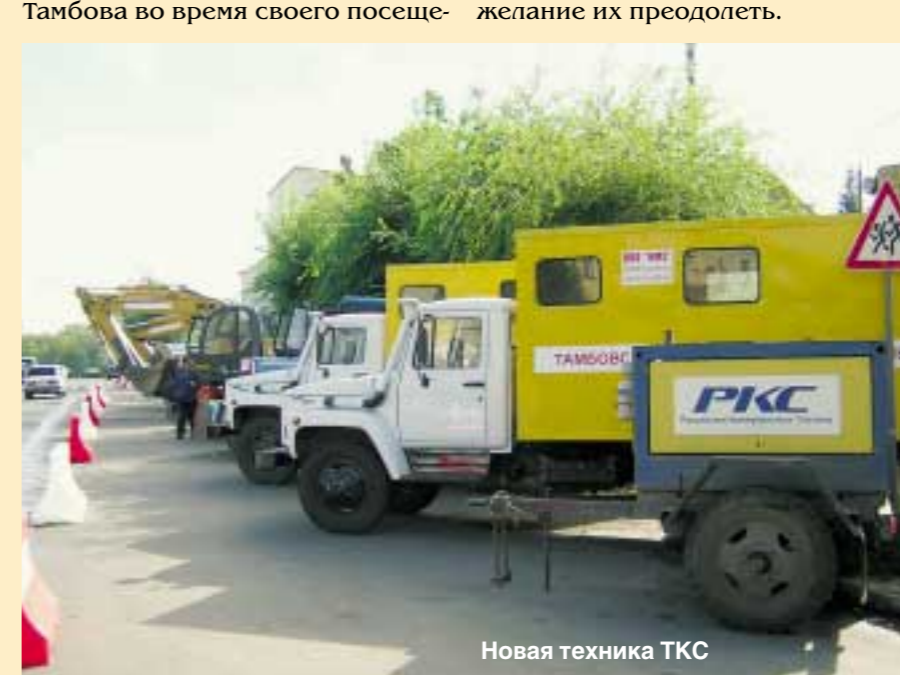
Новая техника ТКС

Не все дочерние компании РКС прижились в регионах. Тамбову повезло — инициатором преобразований здесь выступила власть, и она же поддержала пионера коммунального бизнеса. Не все складывается гладко. Но главное — есть понимание проблем, и есть желание их преодолеть.