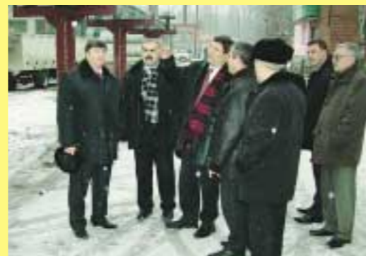
Слева направо: генеральный директор ОАО «Тамбовэнерго» Александр Крапивин, глава администрации города Котова Николай Луговских и губернатор Тамбовской области Олег Бетин на открытии реконструированных сетей Котова

Немало сделано энергетиками области и по реконструкции тепловых сетей. Сегодня активно ведется замена старых изношенных труб на новые с гарантийным сроком службы 25 лет. Это позволяет избежать аварий на теплотрассах из-за порывов в сетях, снизить потери тепла. Кроме того, новые трубы оснащены датчиками, которые контролируют состояние металла и в случае порыва позволяют точно определить его место, не прибегая к обширным раскопкам.