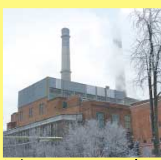
Старейшее предприятие энергосистемы области – Тамбовская ТЭЦ

В результате реализации проекта реформирования ОАО «Тамбовэнерго», кроме уже выделенных дочерних предприятий, 11 января этого года образованы и новые компании, разделенные по видам биз-