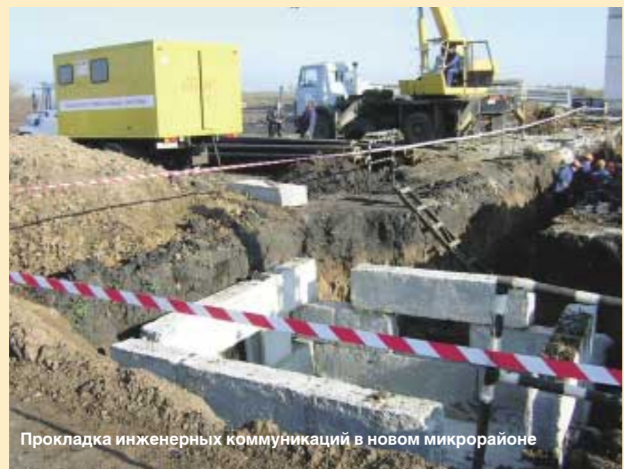
Прокладка инженерных коммуникаций в новом микрорайоне

Не все дочерние компании РКС прижились в регионах. Тамбову повезло — инициатором преобразований здесь выступила власть, и она же поддержала пионера коммунального бизнеса. Не все складывается гладко. Но главное — есть понимание проблем, и есть желание их преодолеть.