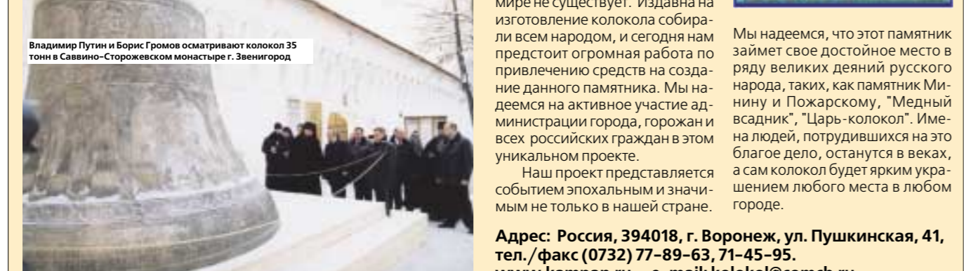
Владимир Путин и Борис Громов освящают колокол 35 тонн в Саввино-Сторожевском монастыре г. Звенигород

Мы надеемся, что этот памятник займет свое достойное место в ряду великих деяний русского народа, таких, как памятник Минину и Пожарскому, "Медный всадник", "Царь-колокол". Имена людей, потрудившихся на это благое дело, останутся в веках, а сам колокол будет ярким украшением любого места в любом городе.