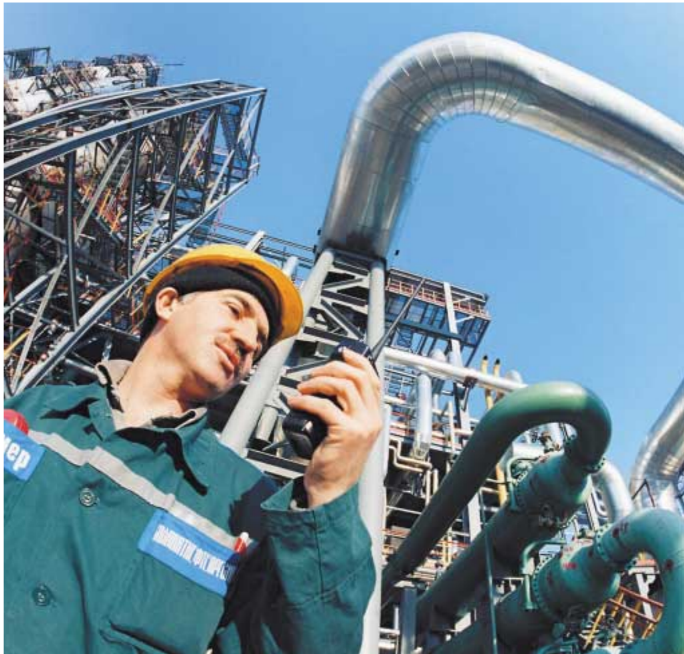
Нефтехимия в России привлекает все больше капиталовложений, хотя их эффективность далеко не очевидна