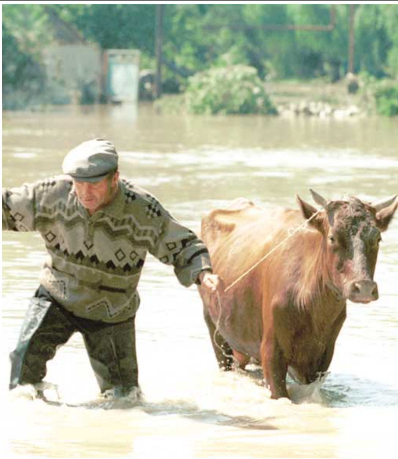
В рамках реализации инвестиционного проекта «Интеко-Агро» молочные реки Белгородской области выйдут из берегов.

Губернатор Евгений Савченко постоянно говорит о необходимости вывода из кризиса животноводческой отрасли региона. Поэтому он оказал поддержку группе компаний «Интеко» в реализации ее аграрного проекта на подведомственной ему территории. По замыслу руководства группы компаний, в ближайшие годы в Ивнянском и Прохоровском районах Белгородской области должны быть построены несколько десятков животноводческих комплексов, оснащенных немецким и итальянским оборудованием, а также закуплено 60 тыс. голов крупного рогатого скота: коров черно-белой голштинской породы